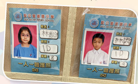
我們的「一人一職名片」計劃