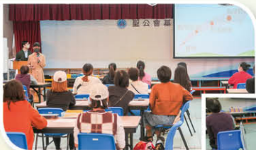
數學科的學習過程應該是由實物有序過渡到抽象的數學符號