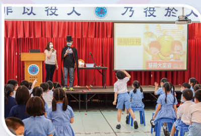
MR S 出場介紹暑期任務。

為讓學生能善用暑假，發展不同的才能，學校設計了一本附有不同任務的「基顯暑期任務 MR S」小冊子及棋盤給學生於暑假期間完成。二年級至六年級學生於9月初進行了暑期任務分享會，分享他們在暑假期間的學習成果。學生在「懷自信·展才能」任務中，展現了他們不同的才華，有的學生打鼓，有的學生跳舞，有的學生變魔術，各人均按自己的興趣發展潛能。另外，有一些極具創意的學生更自製小書或拍攝影片像 Youtuber 般教同學製作小玩意。