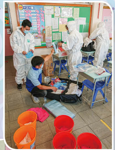
專業清潔的消毒清潔團隊為全校的不同角落消毒

在防疫物品方面，學校亦添購了不同的防疫物品及快速檢測棒等物資，好讓學校有充足的物資應付復課時的不同需要。