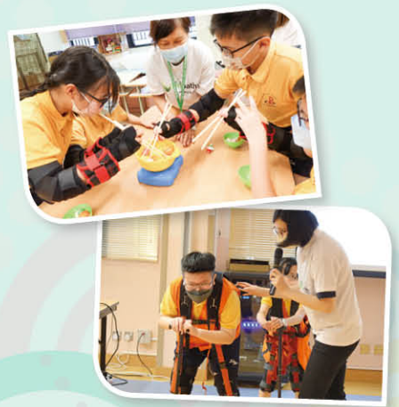
學生更穿上高齡體驗服裝、老花鏡，體會長者行動不便及視力不佳的問題。

是次跨科閱讀及體驗學習計劃能使學生明白關愛身邊人的重要，並發展他們的創造力，因此本校老師獲邀於7月份在教育局「跨課程閱讀分享會」分享計劃成果。