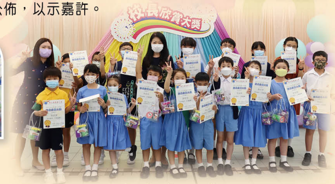
校長欣賞大獎開心大拍照