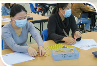
家長們也嘗試操作學生在課堂上使用的學習用具