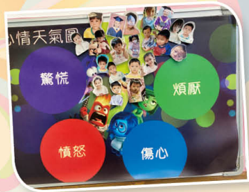
「心情天氣報告」：我們今天很开心。