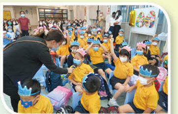
小一同學分享他們的願望。