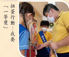
「扭蛋行動：我要「一等獎」」