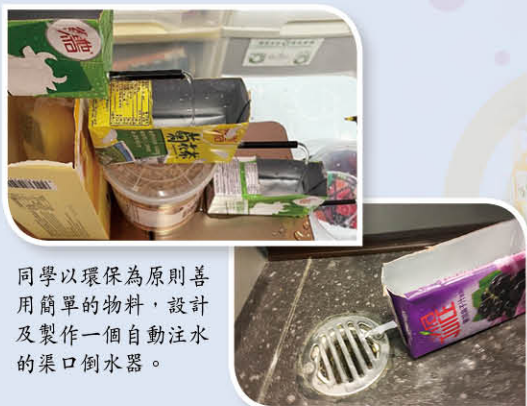
同學以環保為原則善用簡單的物料，設計及製作一個自動注水的渠口倒水器。