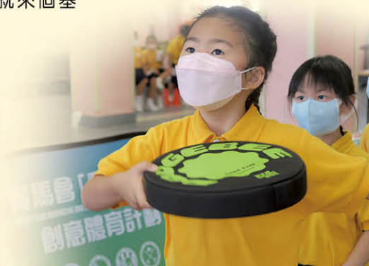
你的眼睛看到目標，我的眼睛看到專注