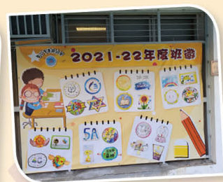
我們的驕傲：全校「班徽」匯聚一堂。