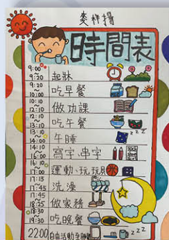
學生為自己設下在假期裡要完成的「任務清單」(Duty list)。

一至三年級同學在假期中，學習自我管理，化身時間管理達人，製作時間表，規劃如何善用特別假期的時間，並設計及完成「任務清單」(Duty list)，學習做一個有承擔的KHeroes。另外，一至六年級同學均在「彩繪口罩」及「生活中的音樂」活動中，發放正能量。在「假如我是……」及「童心打氣」的活動中，為勇敢地走在前線、照顧及醫治病患者的醫護人員打打氣，給他們鼓勵，共同對抗疫情！