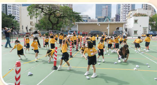
壞習慣就像紙球一樣，被我拋棄了(扔紙球大賽)