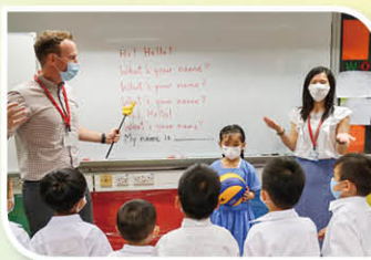
What is your name? My name is.....