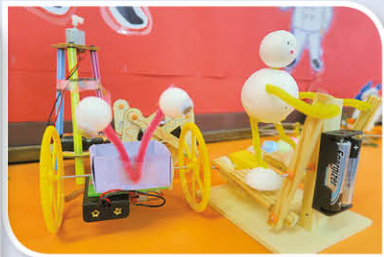
六年級同學的機械人作品。