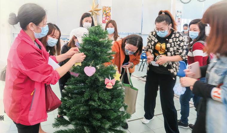
工作坊結束後，家長們一起在聖誕書掛上對孩子的祝願