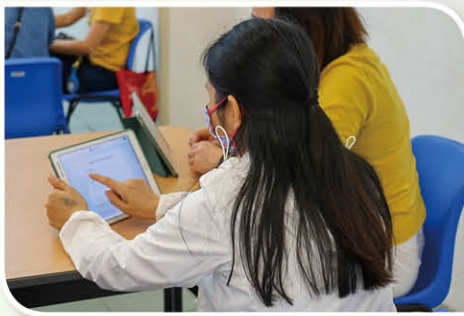
透過投票活動，掌握在親子伴讀時提問故事問題的方法

另外，在工作坊上，家長亦能透過小遊戲親身體驗幫助小朋友認字及識字的方法，並認識尋找語文學習網上資源的途徑，好讓家長能運用多元化的方法及教材，輕輕鬆鬆協助子女學習語文的同時，也能促進親子關係。