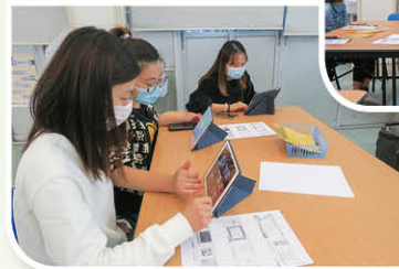
家長們一起學習使用不同的電子工具