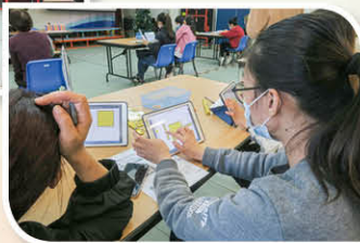
即使家中沒有教具也可以使用相似的電子工具幫助學生學習