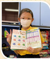
YEAH!我成功在「奮進之星」成功獲獎!