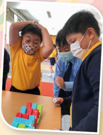
同學正全情投入「小息桌遊-層層疊」遊戲當中。