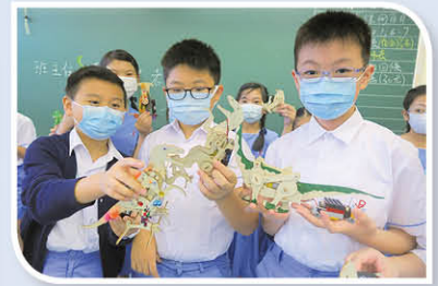
五年級同學製作機械動物進行爬行比賽。