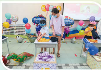
快快!自理能力我最勁。