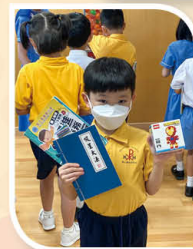
我真的很幸運，扭到「一等」和「四等」獎呀!