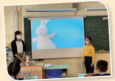
「寶貝玩具分享」讓大家都對同學有更深刻的認識和感受。