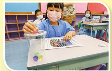
你有賞!同學完成一項活動，就會獲得鑽石一粒。