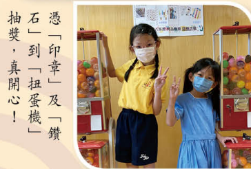
憑「印章」及「鑽石」到「扭蛋機」抽獎，真開心!