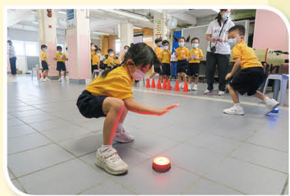
「反應燈」都無我咁好反應