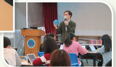
教師逐一展示不同課題上課時使用的教具