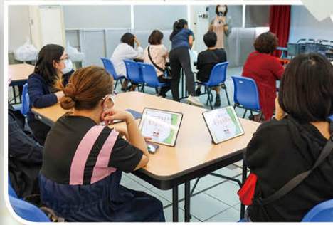
家長正投入地一同閱讀繪本