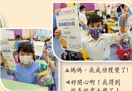
▲媽媽，我成功獲獎了!