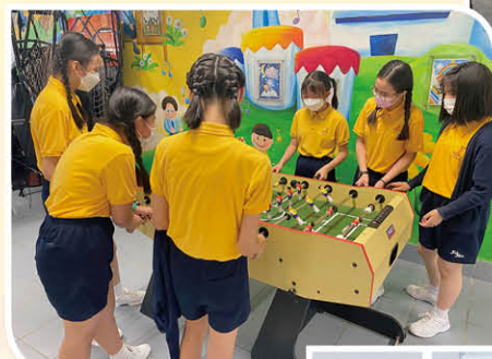
女同學也喜歡足球機活動呢！