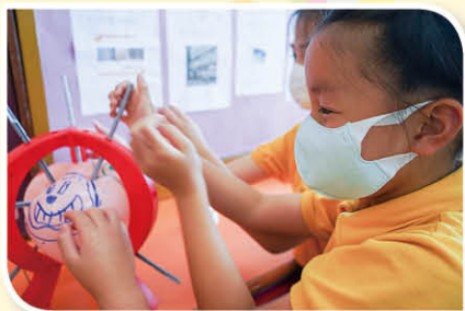
「你仲唔輸！」(蠢惑地笑)

旅行日是每個學生的盼望，今年因疫情關係沒有了旅行日，我們就來個基顯「裏」行日，讓學生在校內渡過一個充滿笑聲和汗水的早上。