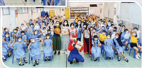
MARIO也到場為同學打氣!