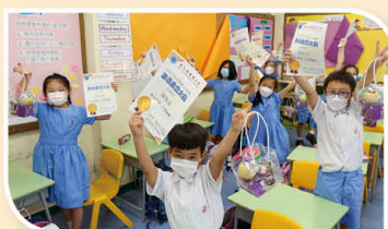
YEAH!我們都成功獲獎呀!

老師們特別隆重其事地佈置典禮場地，訂製各式各樣的Q版拍攝裝飾，由校長向每位奮進努力及毅力滿滿的同學頒發證書及禮物，並與同學一起拍攝「開心Q版相片」，及後學校更會將頒獎典禮精華連同獲獎名單於校網公佈，以示嘉許。