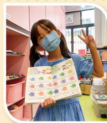
我也成功在「毅力大獎賞」獲得兩版印章。