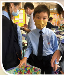
成功完成溫習「挑戰任務」，可以一手盡取「鑽石」機會，真興奮!