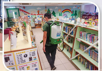
在每一個課室及特別室均噴灑上消毒塗層