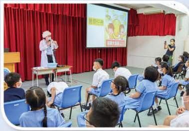
基顯科學家向同學分析STEM任務。

學生在「STEM 玩中學」任務中，製作了不同的STEM 作品，包括自製玩具(二年級)、運輸小工具(三年級)、太陽能小工具(四年級)、動物拼砌樂(五年級)及機械人(六年級)。各級學生於分享會中，展示其作品，並由同班同學選出最具創意的作品。