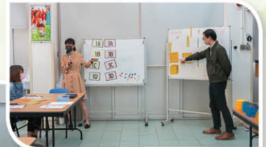
教師示範教授加法進位和減法退位的步驟和過程

為使一年級學生能適應小學的數學課程，今年數學科為一年級的家長準備了一次「家長數學工作坊」，讓家長了解一年級數學科的課程、教師在課堂的教學模式、以及家長如何協助學生在家中溫習。當日家長除了認識到不同課題的教學方法外，還親身試用課堂上的教具。家長扮演著學生的角色，體驗操作教具的過程，對孩子的學習有更深入的體會。