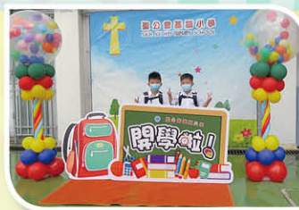
小一生齊拍攝「開學啦!」照片。

小一滿月慶祝會非常熱鬧，學校邀請了小一家長到校，與其孩子一同分享成為基顯一分子已一個月的喜悅。全級一年級同學即席演唱了「If you are happy」英文歌曲，表達他們愉快的心情。老師亦為同學及家長準備了小遊戲，讓他們一展身手。各班派出代表鬥快摺校服和砌校徽，代表同學及家長均全力以赴，落力完成小任務。最後，由小一同學代表帶領眾人祈禱，同頌主恩，為滿月會寫下完美的句號。