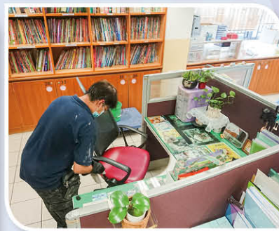
工友叔叔們落地地消毒校園