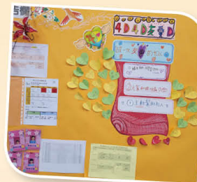
簡單而到位的「班呼」口號，振奮同學的心。