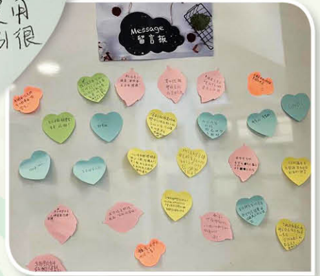
留言版上滿是家長對是次語文家長工作坊的感謝