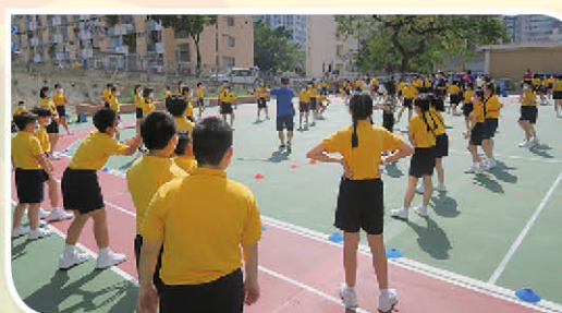
團結就是力量：班際躲避盤比賽