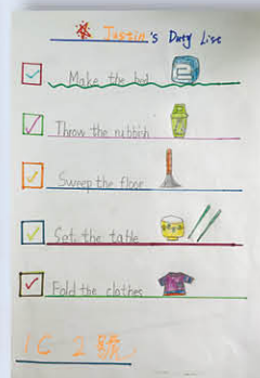
學生在假期中，自行製作時間表，學習時間管理。