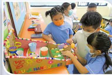
二年級同學自製玩具，大家一齊玩樂，非常開心。