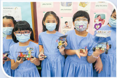
三年級同學設計運輸工具。