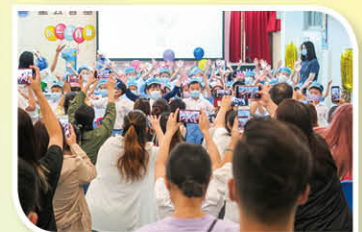
全級小一同學表演「If you are happy」英文歌曲。