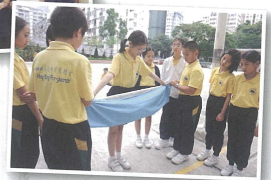
隊員們認真學習摺國旗的方法