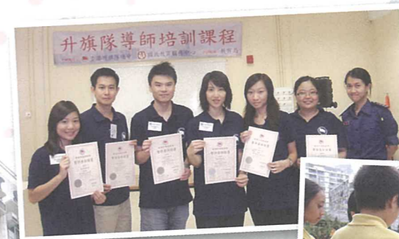
多位老師完成升旗隊導師培訓課程

隨着升旗隊將國旗徐徐升起，仰天凝望，火紅的國旗在藍天白雲下飄揚。舞動的旗幟，不僅象徵了我們中國人的身份，還展示着本校升旗隊隊員和老師們的信念和努力。