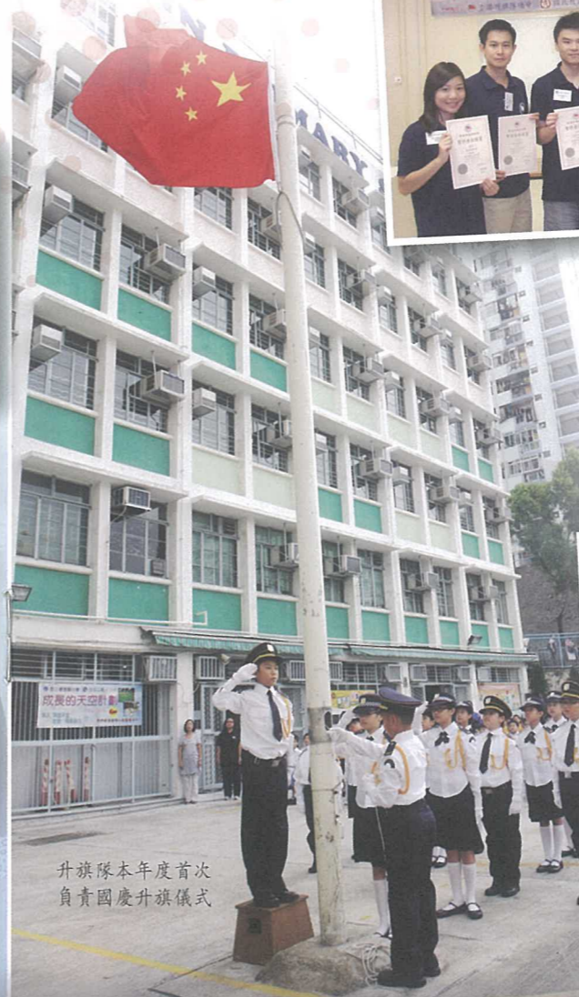
升旗隊本年度首次負責國慶升旗儀式