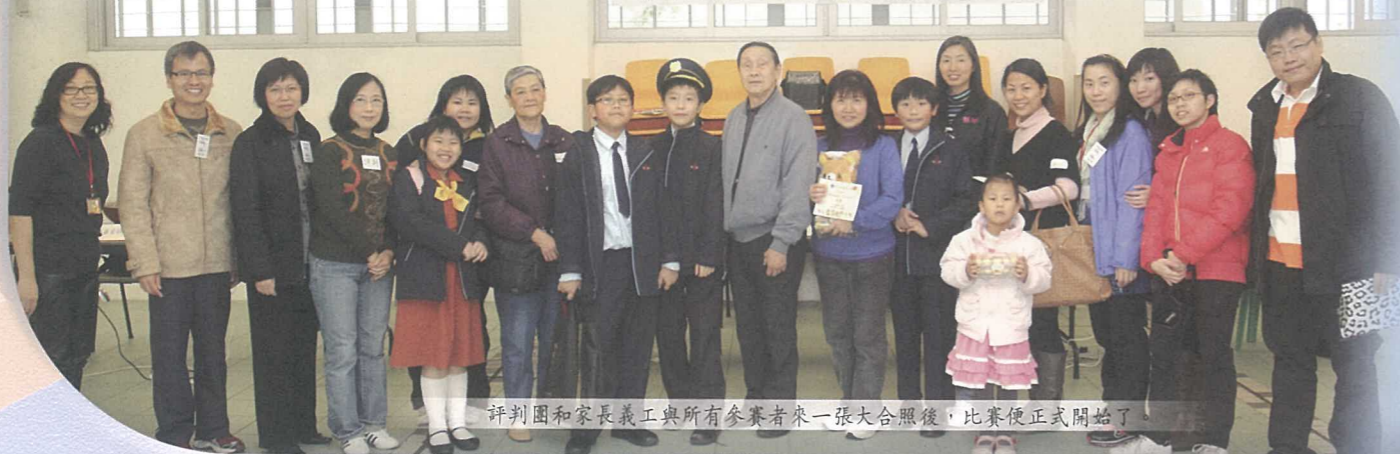
評判團和家長義工與所有參賽者來一張大合照後，比賽便正式開始了