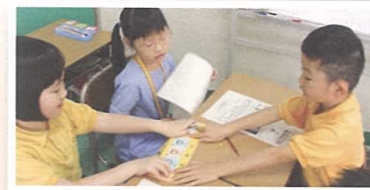
配合「先說後寫」的教學策略，學生們正利用行為句卡分享故事，再進行寫作。