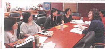
校本支援服務處的學校發展主任正跟二年級中文科老師進行共同備課，大家多認真啊！