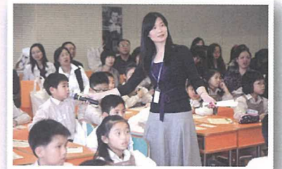
示範課中，學生們積極參與課堂活動。