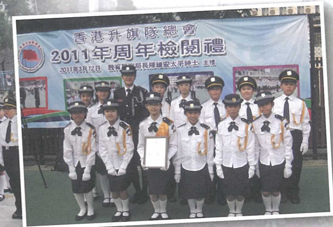
在周年檢閱禮中獲得步操比賽亞軍