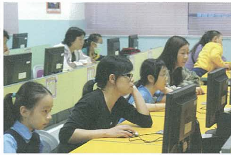
家長資訊科技教育計劃