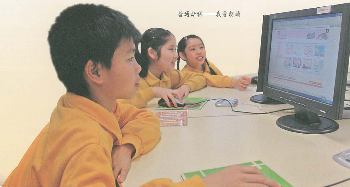
普通話科——我愛朗讀