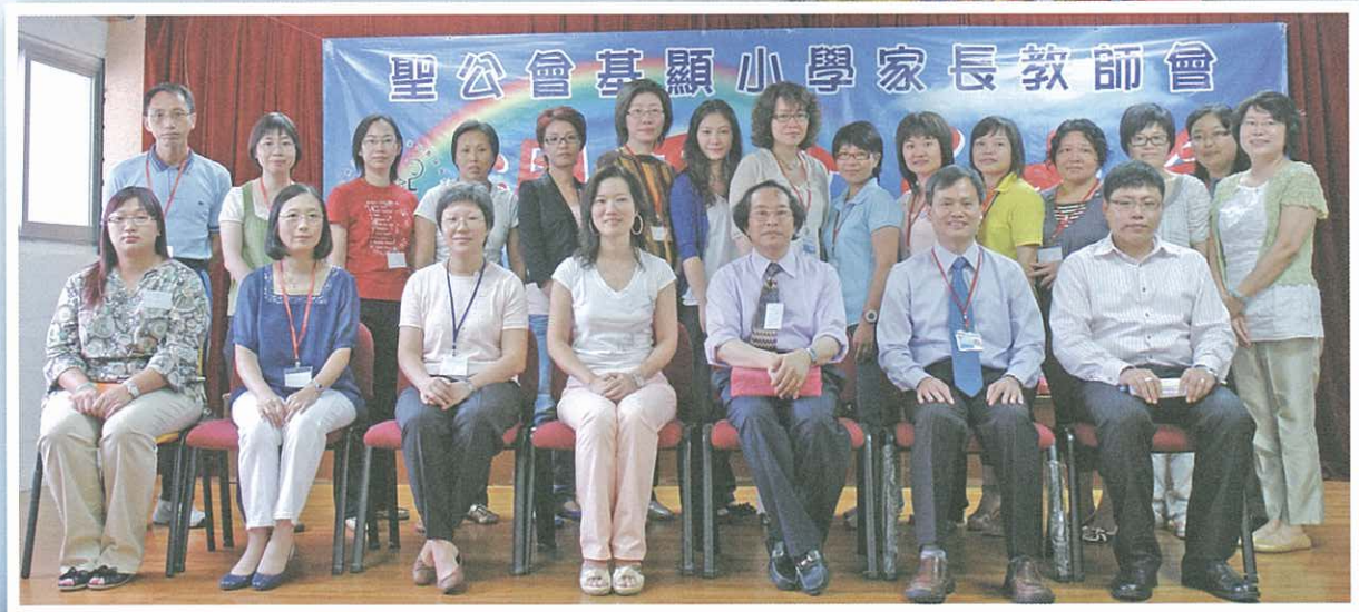
新舊執委一起來張大合照