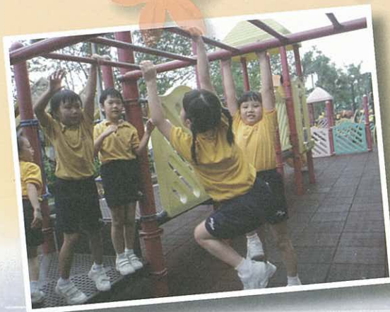
加油！加油！尚有兩格就成功了！