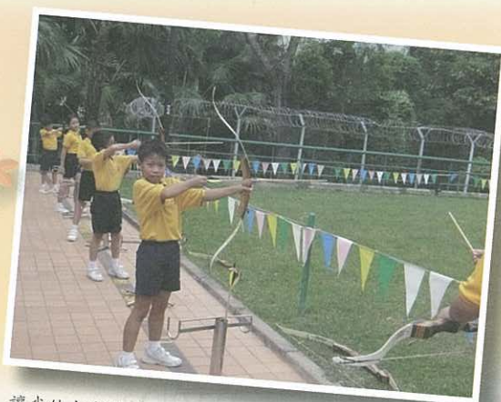
讓我給大家表演一下絕技——百發百中！