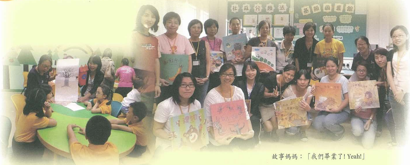
故事媽媽：「我們畢業了！Yeah！」