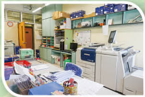
一樓油印室新貌，油印設備齊全，印製試卷及工作紙的效率大大提升。