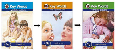
Key Words with Peter and Jane series

The set of books has 12 different levels, each consisting of 3 books. Students read the books from 1a, 1b and 1c to 12a, 12b and 12c.