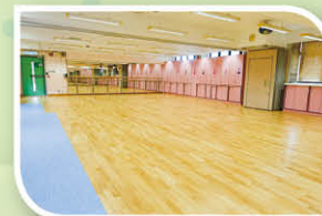
二樓舞蹈室新貌，話劇組及中國舞隊有更優質場地盡展所長。