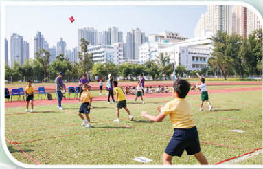
男子高級組擲接豆袋的激烈比賽情況。

本校游泳隊及遊戲隊於本年度九龍東區小學校際比賽獲得多個獎項。獎項對同學是肯定及鼓勵，惟學校更希望同學能透過刻苦的訓練及比賽中的歷練，鍛煉出堅毅的意志及積極向上的態度，學懂「勝不驕，敗不餒。」的體育精神。