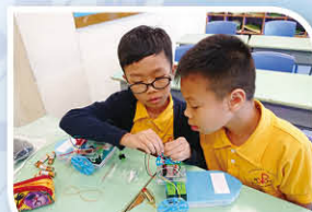
科學放大鏡(製作模型船)