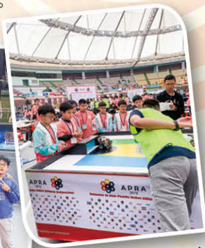
機械足球賽如箭在弦，選手們都全神貫注，準備應戰！