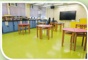
一樓常識室新貌，安裝了86寸SMARTBOARD及廣播系統，能配合學校STEM教育及電子學習的目標。