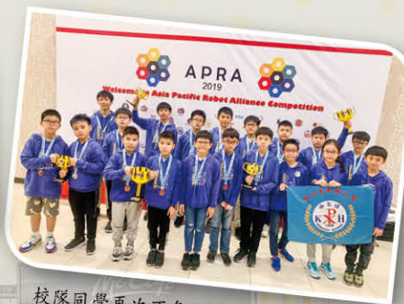
校隊同學再次不負所望，為香港爭光！