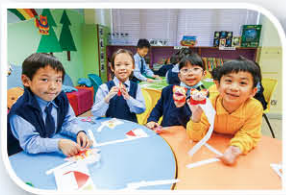
閱讀摺紙樂(摺出小紅帽)