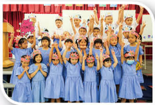
各班小一同學演唱英文歌曲，歌聲嘹亮。

我們在此祝願同學在校長、老師和教職員的關心愛護下，茁壯成長，成為愛主愛人的好兒女，活出我校信條「勇敢、忠信、喜樂」。