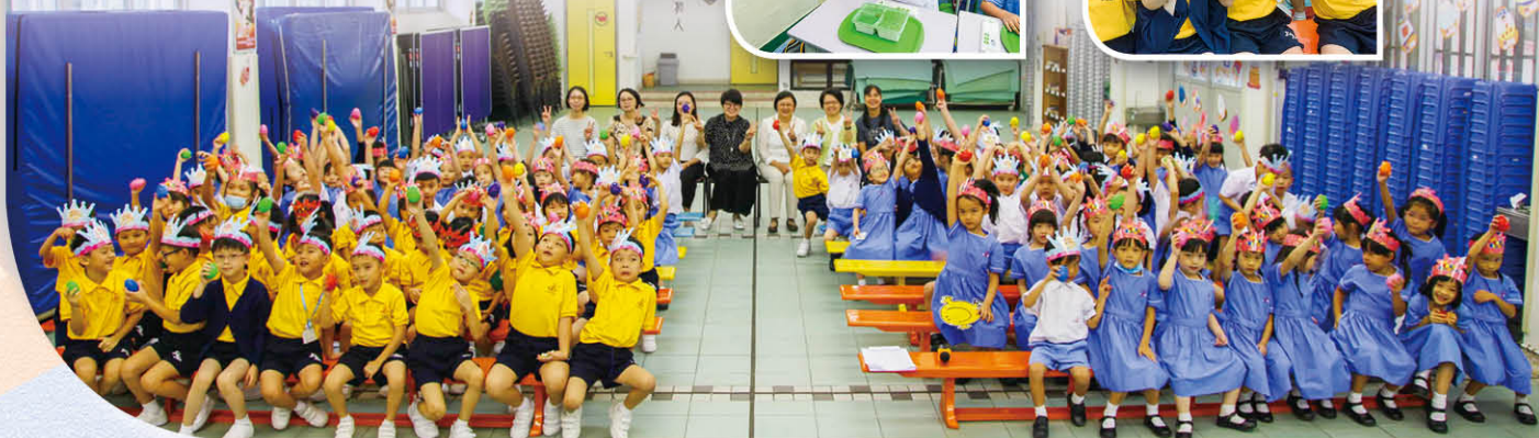
整個禮堂滿載笑臉和歡笑聲，大家非常投入。