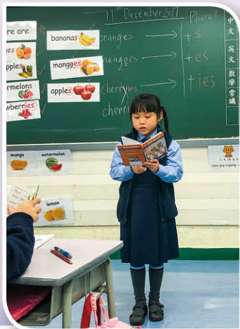
The Read-aloud Scheme helps students build up the confidence in speaking English.