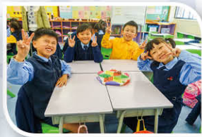
童年拾趣(玩玩波子棋)