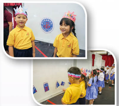
各班小一代表鬥快砌校徽，氣氛歡愉。