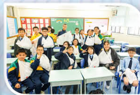
急救小先鋒(包紮大手掛)