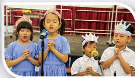
小一同學代表帶領眾人祈禱，同頌主恩。