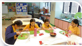
無火煮食(Yum Yum Tuna小點)