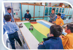
Lego機械人小菁英(高級組) (機械足球)