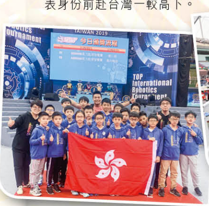
同學們過五關斬六將，辛苦取得香港代表資格參賽，將會成為他們人生中珍貴的回憶。

基顯智能機械人校隊有一句口號：「贏就一齊贏，輸就一齊輸！」，校隊內眾人團結互助的精神，一起為學校爭取榮譽的鬥心，是基顯在機械人競賽中一直保持戰績彪炳的原因。在此特別感謝一批已畢業的中學師兄們，在無數個校隊訓練及加時練習的日子，放學立即趕回學校，抽空替師弟妹們積極備戰，成就今次的大豐收。明年賽事將會移師泰國進行，期待智能機械人校隊再為基顯爭光奪魁！