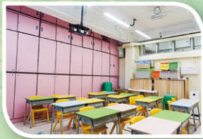
一樓105小班教學室新貌，教學設備更齊全，提升小班教學質素。

為培育多功能的基顯人，二樓舞蹈室重新鋪設木地板，更加裝大量組合櫃，讓學校的話劇組及中國舞隊有更優質場地盡展所長。