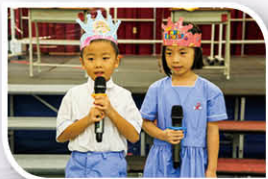
小司儀以英文及普通話與眾人打招呼，勇氣可嘉。