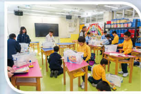
機關王(氣動與氣壓)