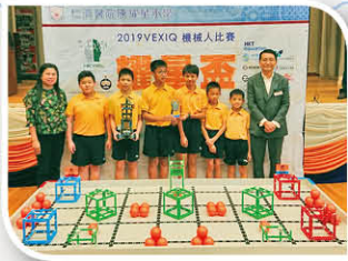
2019 VEX-IQ 機械人比賽——耀星盃，獲得「閃耀新星」獎。

近年教育局鼓勵STEM教育，加上本校常識科科本特色「動手做」，VEX-IQ機械人套件強調創建之餘，亦需要高技巧的操控能力，正好配合學校發展需要。因此，本校於2019年夏天引進VEX-IQ機械人套件，讓學生接觸不同的STEM元素教件，在發揮「動手做」之餘，透過參加比賽訓練學生堅忍，面對挑戰