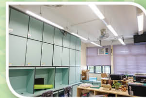
一樓新增校務處(二)，令校務處職員工作更舒適。