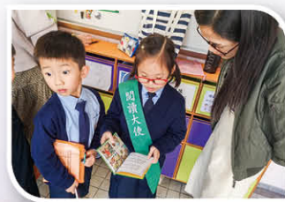
The Read-aloud Scheme is also a self-directed learning programme. Students follow their own abilities to pursue up-level books.