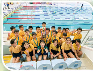
本校獲得九東游泳男子甲組團體亞軍。