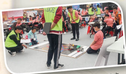
銀河守護任務講求精密的程式編寫與機械組裝，考驗隊員間的合作性與默契。