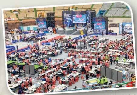
桃園小巨蛋內滿是各國參賽的選手，氣氛熾熱，盛況空前！