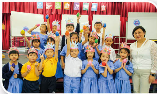
駱校長與同學拍照留念，見證孩子成長重要的一刻。