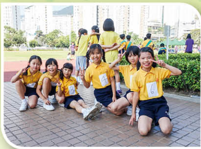
女子高級組障礙賽跑獲得殿軍。