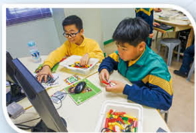
Lego機械人小菁英(中級組) (編程)