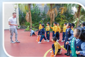
English Sport Games(Beanbag Relay)