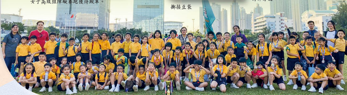
本校獲得九東遊戲男子高級組團體季軍及女子高級組持棒穿圈冠軍。