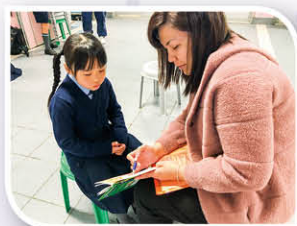
Parents are also involved in the Read-aloud Scheme.