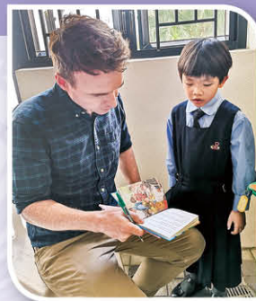
The Read-aloud Scheme provides students opportunities to speak English with teachers.