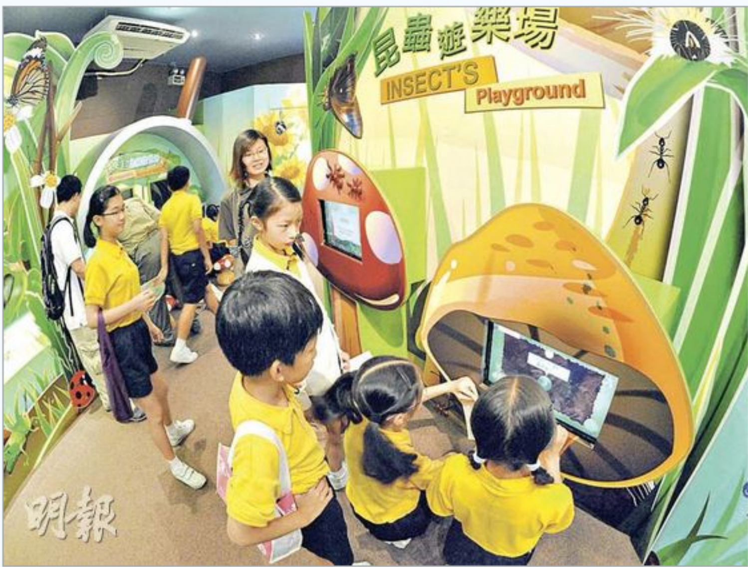
獅子會自然教育中心昆蟲館翻新後重新開放。

【明報專訊】本港昆蟲種類豐富，單是蝴蝶品種已約200種。位於西貢蕉坑獅子會自然教育中心的昆蟲館，經過約半年翻新工程後重新開放，日後市民可於佔地150平方米的昆蟲館內，觀賞約40種昆蟲標本和水生及陸生昆蟲，亦可透過展板、互動遊戲、顯微鏡等，探索奇妙的昆蟲世界。